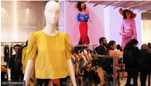
자라는 영국에만 64개 매장을 보유하고 있으며, 전 세계에 7,490개의 매장이 있다

친환경 의류: 자라에 헌옷 수거함이 생기는 까닭 - BBC News 코리아